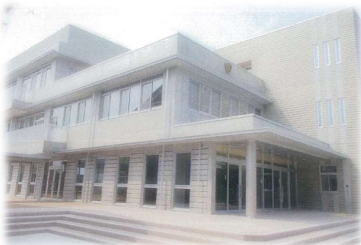
▲田中小学校新校舎(平成26年7月完成)