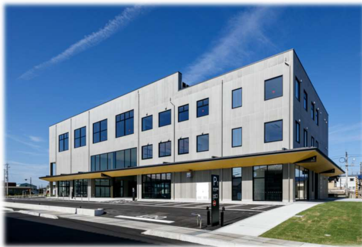
▲中滑川複合施設「メリカ」(令和4年9月完成)

まちなかにおける賑わいの創出と交流人口の拡大に加え、 避難スペースをはじめとする防災機能も確保した、多様な 機能を備えた施設だよ。