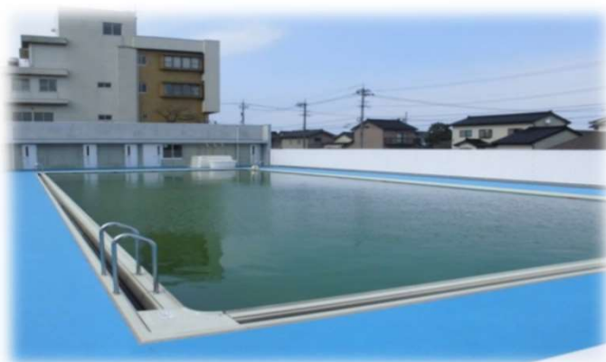
▲田中小学校プール改築(平成28年6月完成)