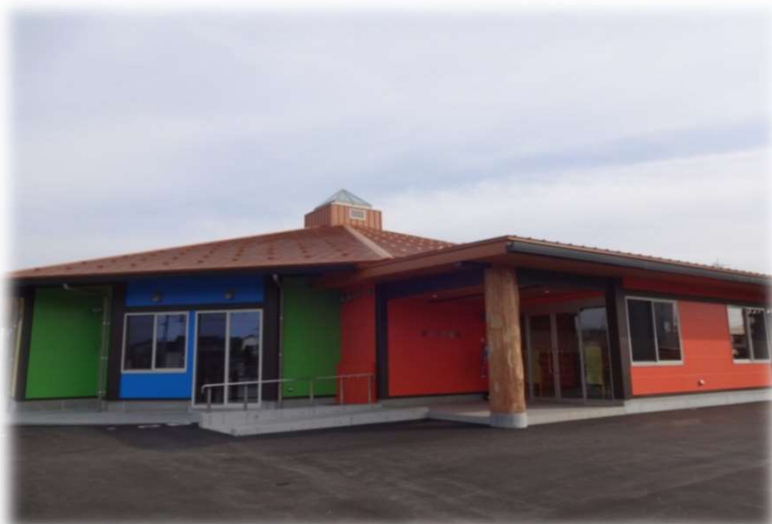
▲児童館(平成28年3月完成)