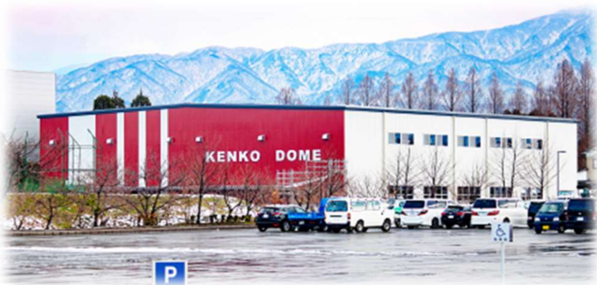
▲屋内運動場「KENKO DOME」 (平成30年1月完成)