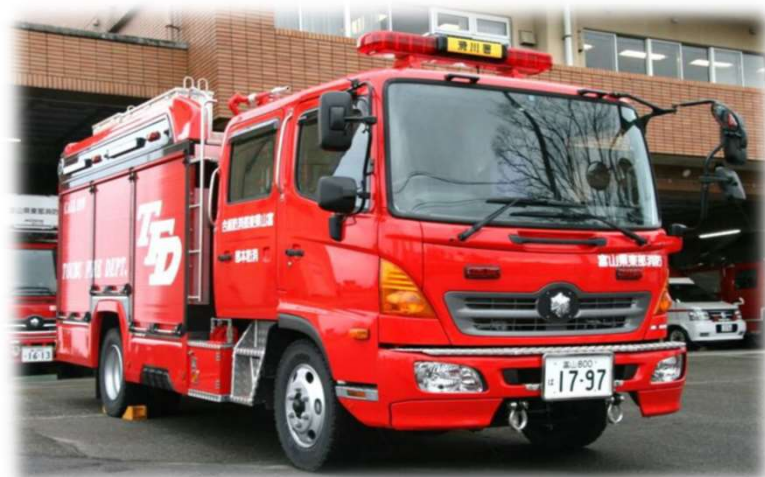
▲災害対応特殊水槽付消防ポンプ自動車 (平成28年12月納車)

新しい消防ポンプ自動車がやってきたよ。 災害はいつ起こるかわからないから、 備えが必要だよ。