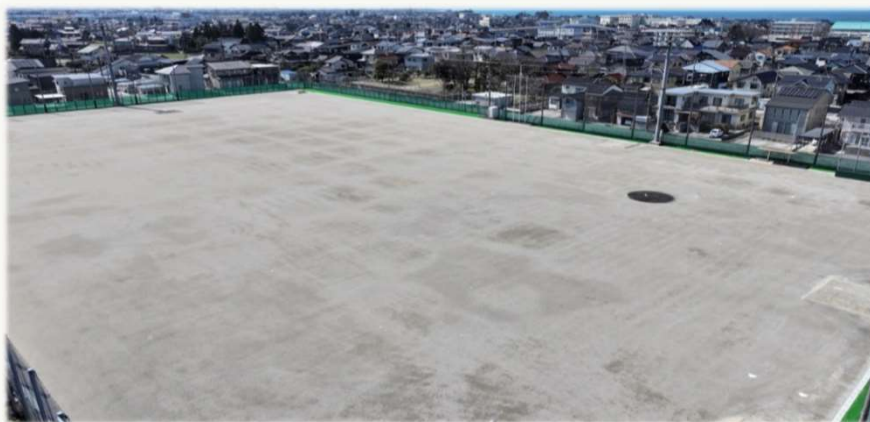
▲滑川中学校グラウンド改修(令和7年3月完成)

グラウンドが新しくなったよ。 みんなでいっぱい遊んだり、 部活動で利用できるね！