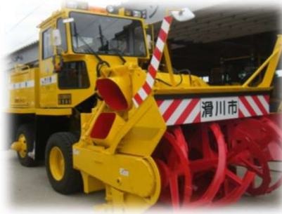
▲ロータリー除雪車