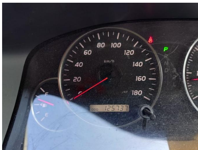
走行距離メーター