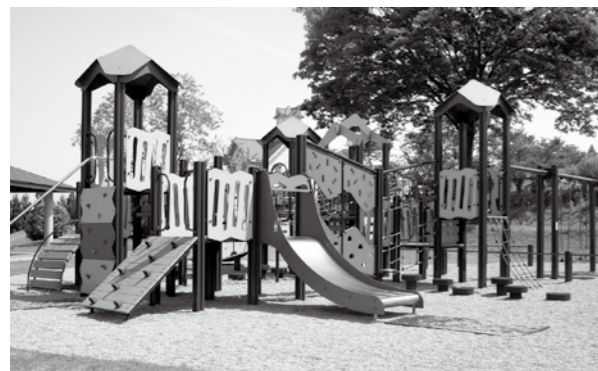
東福寺野自然公園大型遊具