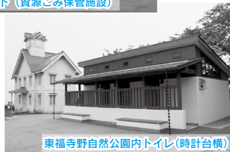
東福寺野自然公園内トイレ(時計台横)