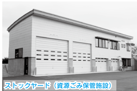
ストックヤード(資源ごみ保管施設)