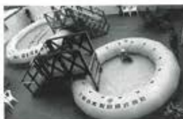
深層水で「浮夏浮夏」体験 特設会場