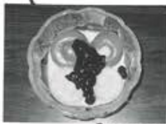
滑川市食生活改善 推進協議会より