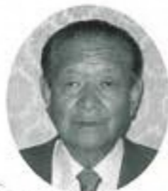
勲六等単光旭日章

女性初の果の管理職 に就かれるなど、女性 の地位向上に尽くされ、 現在市社会福祉協議会 会長を務められています。