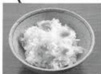
滑川市食生活改善推進協議会より