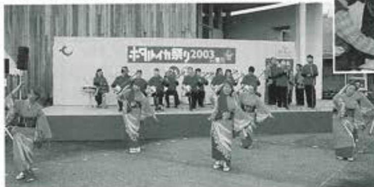
ホタルイカ祭り2003 (4月26-27日 ほたるいかミュージアム周辺)