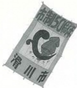
世界風揚げ大会に 参加、滑川市制50 周年をPR (5月18日 大門町)