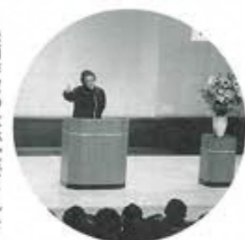
映画作家の大林宣彦さんを 講師にNHK公開セミナー (5月11日 早月中学校地域 交流センター)