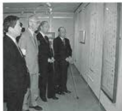
現代書の父 金子鶴亭回顧展 (4月26日-5月11日 博物館)