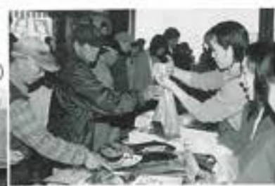
お魚まつり (4月27日 滑川漁港周辺)