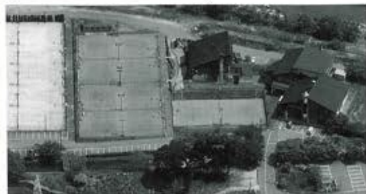
みのわテニス村(辺地対策事業債)