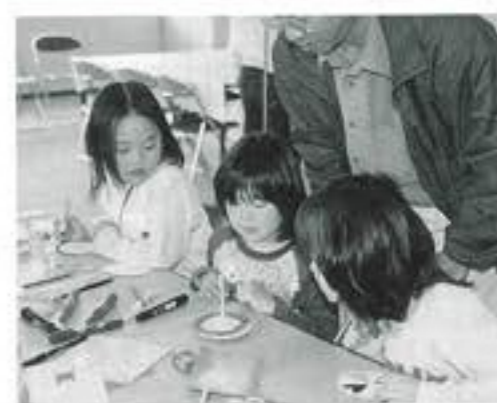
楽しさを学ぶ移動科学館 チルドレンズ・ミュージアムイ なめりかわ (5月17-18日 博物館)