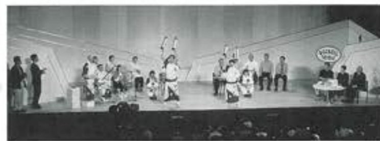
NHKラジオ「ふるさと自慢・うた自慢」公開録音(5月2日 総合体育センター)