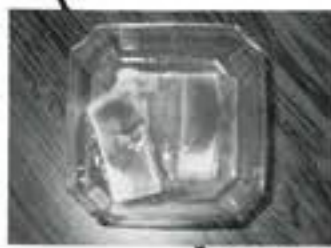
滑川市食生活改善 推進協議会より