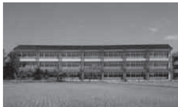
西部小学校校舎増築完成