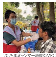
2025年ミャンマー地震