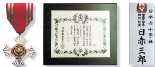
(個人:金色有功章) (個人:銀色有功章) (個人:特別社員) (法人:銀・金色有功章) (個人:銀・金色有功章)