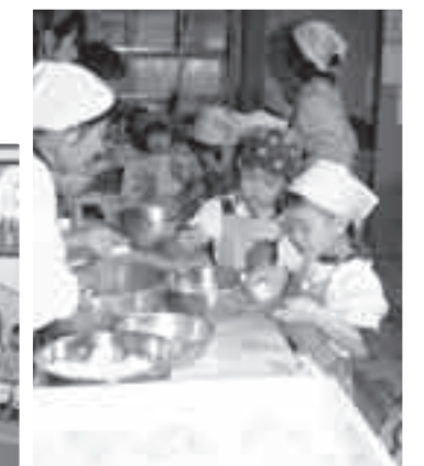
自分の手で餡子やきな粉、ごま にお餅をまぶすあずま保育所の 園児たち