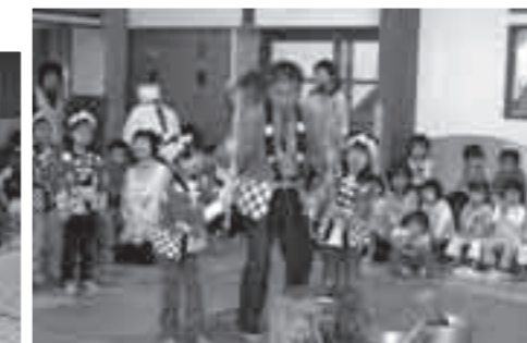
市長と一緒に餅をつくあずま保育所の園児たち