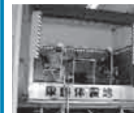
←地震体験車「グラット君」 で地震を体験する子供たち (中加積・山加積地区)

10月30日、寺家小学校グラウンドを中心に東地区防災避難訓練が実施されました。住民はグラウンドへ避難した後バケツリレーで消火訓練を行いました。