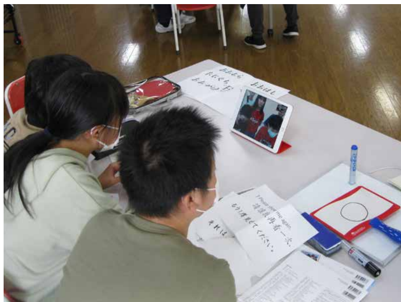
オンラインによる交流学习