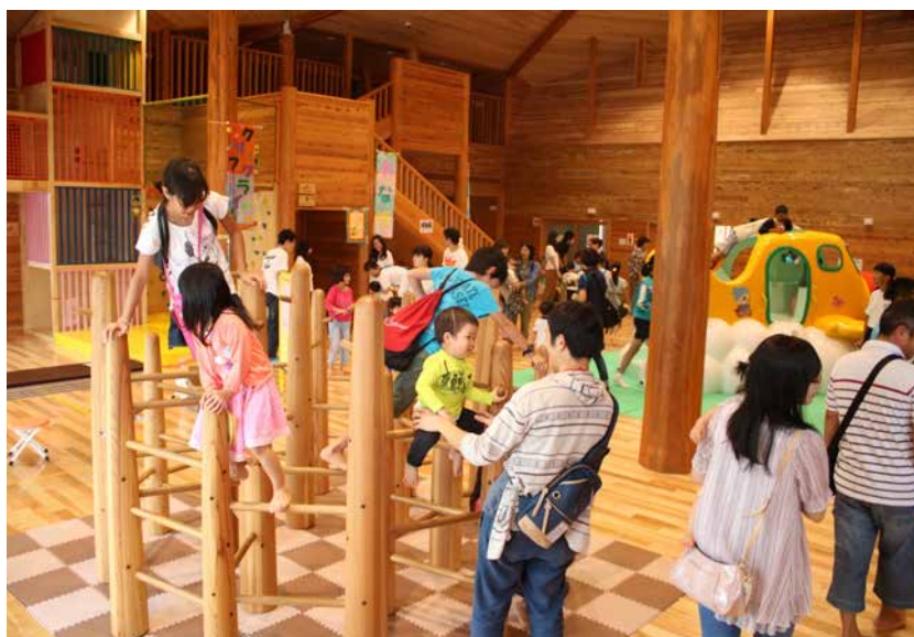
市産木材をふんだんに使用した児童館