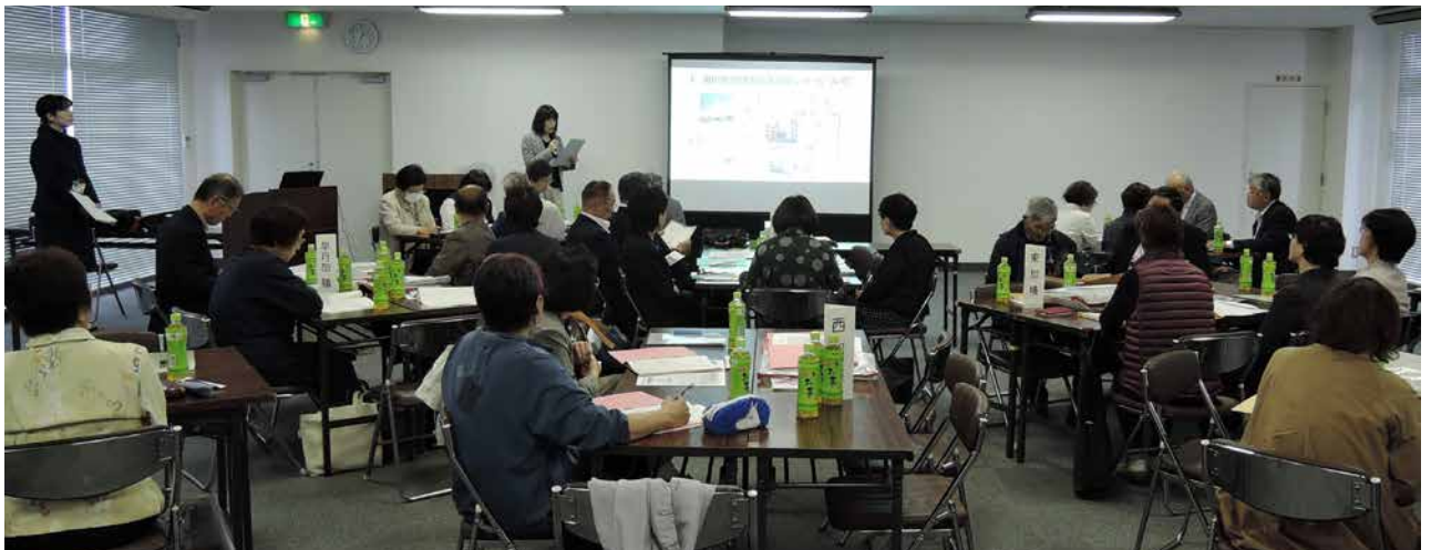
協議体の様子（地域住民による情報交換）

互助を中心とした地域づくりを住民主体で進めるために、助け合い活動をともに創出し、充実させていく組織。