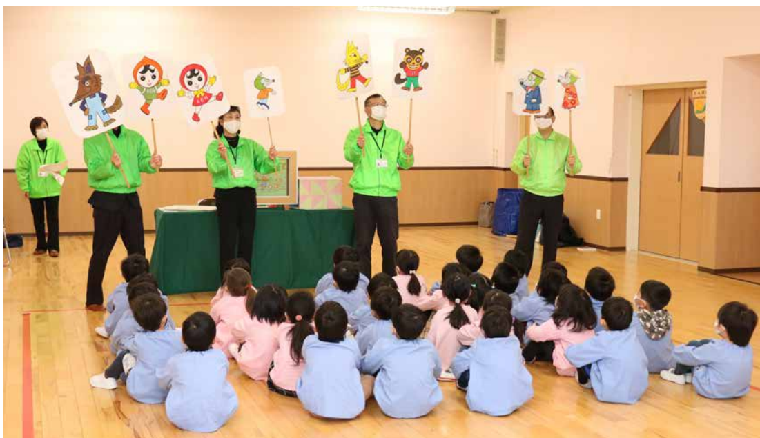
人権擁護委員による啓発活動

一人一人がやりがいや充実感を感じながら働き、仕事上の責任を果たすとともに、家庭や地域生活などにおいても、人生の各段階に応じて多様な生き方が選択・実現できる社会。