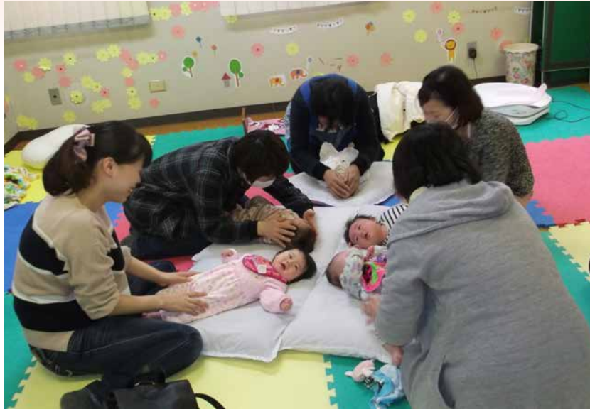
子ども未来サポートセンターの子育て支援事業