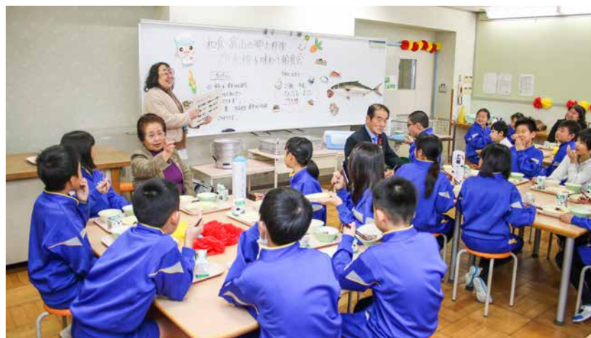
学校給食なめりかわの日