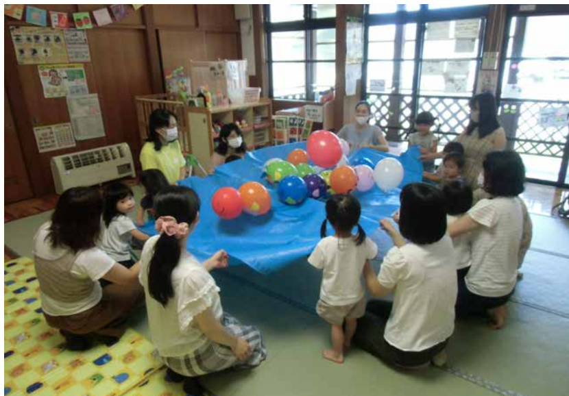
子育て支援センターの子育てサロン