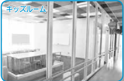
キッズルーム 工作などのワークショップを行います。