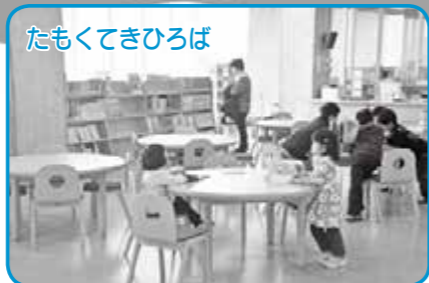
たもくてきひろば 『たもくてきひろば』は、本を読んだり、調べものをしたりする場所です。