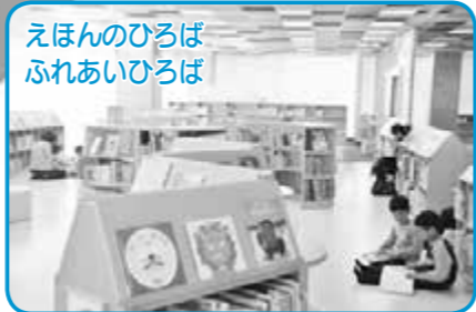
えほんのひろば ふれあいひろば 『えほんのひろば』には、絵本、紙芝居、大型絵本が配架されています。 『ふれあいひろば』は、保護者同士や子ども同士の交流や情報交換の場所です。