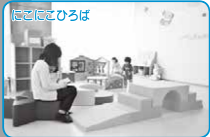
ここにこひろば 小さなお子さんのための部屋です。保育士が配置されており、子育てに関する相談もできます。