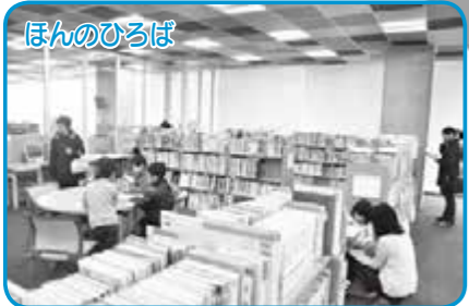
ほんのひろば 小学生・中学生向けの本が配架されています。