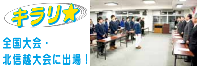
▲12月18日に行われた出場者激励会の様子

編集後記・お詫びと訂正 ▼先月号の記事の中に誤りがありました。▼10・11頁に掲載しました市民カレンダーのなかで、市民交流プラザ 悠友サロンおよび学校開放調整会の日程を13日(火)としておりましたが、正しくは20日(火)でした。お詫びして訂正いたします。▼先月号の広報クイズに100通を超えるご応募がありました。ご意見やご感想などのほか、私への応援のメッセージなども頂戴しました。とても嬉しかったです。歳を重ね、涙腺が緩くなったのか、目からしょっぱい水が出て。同僚にバレないようにこっそり席を外してしまいました。このほか、キプリンへもたくさんのお年賀状を頂戴しました。キプリンは今月号の子育てレポートの提出で少しお疲れ気味のため、代わってお礼申し上げます。皆さん、ありがとうございました。(S)