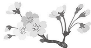
保育所給食栄養士担当