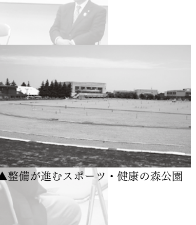
▲整備が進むスポーツ・健康の森公園

以前、千葉県に生のホタルイカを一週間毎日運んで光らせる試みをしたことがありますが、うまく光ってこない日もありました。ホタルイカの時期はメインが海上観光ということもあり、難しい面もありますが、北陸新幹線が開業することもあり、いろんな手を尽くしてPRしていきたいと思っています。 海上観光船の出航・欠航の判断は船長がしています。観光船は定置網