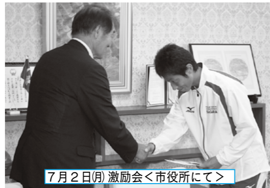
7月2日(月) 激励会<市役所にて>