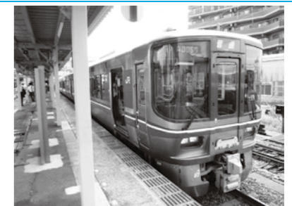
▲導入予定の新型車両(521系)

並行在来線にあたる鉄道路線は、新幹線が開業したらJRがその経営をやめる方針があるから、そう区分して呼んでいるんだよ。 ※並行在来線と新幹線の両方をJRに経営させることは二重投資になるって理由から、新幹線開業時に並行在来線の経営を分離することが国の方針として決められているんだよ。