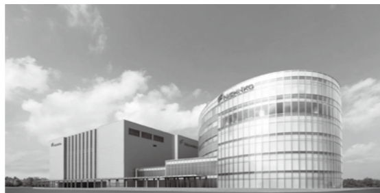
▲滑川第一工場 外観