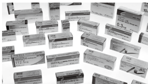
▲医療用薬品の一部