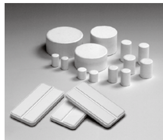
▲半導体用金型クリーニング材