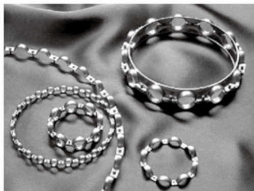
◀玉軸受用保持器(リテーナ)