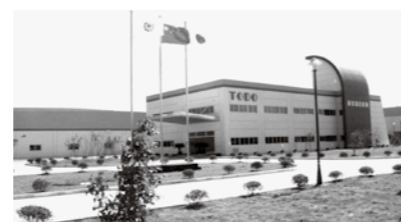
▲蘇州藤堂精密機械有限公司 外観

関連会社 蘇州藤堂精密機械有限公司(中国江蘇省蘇州市) 主な取引先 日本精工(株)、(株)不二越、NSKワナー(株)、シミズ精工(株)、NTN(株)、旭精工(株)、(株)スズキ部品富山 ほか