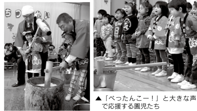
▲「べったんこー!」と大きな声で応援する園児たち

坪川保育所で「もちつき会」が行われ、園児と市長、教育長らがきねと臼でもちをつき、恒例行事を楽しみました。