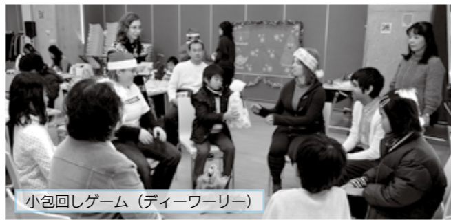
小包回しゲーム (ディーワーリー)

クリスマス、ハヌカー、ディーワーリーの祭りにちなんだゲームや工作など、集まった市民が異文化交流を楽しみました。