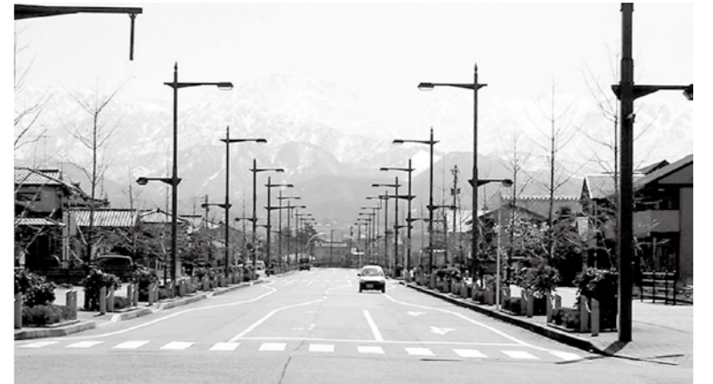
都市計画道路 滑川駅国道線