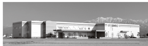
▲三晶MEC富山工場 外観