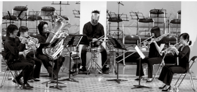
▲馬に扮装し、観客を楽しませるゲストのブラスアンサンブル匠