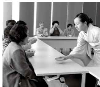
▶立礼席<市民交流プラザ>

「第22回市民ふれあい茶会」が市民交流プラザと延槻亭で開かれ、多くの人が静寂の中の一服を楽しみました。呈茶サービスは5月から11月までの間、月に1～2回、延槻亭で行われます。