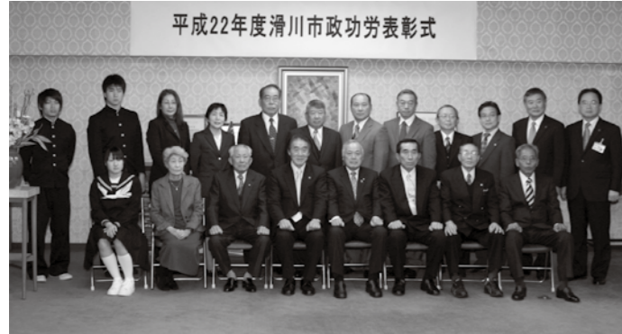
平成22年度滑川市政功勞表彰式

市政功勞表彰式が市役所で行われ、市政の各分野で功績のあった13個人と1団体を表彰、また1団体に特別感謝状を贈呈しました。