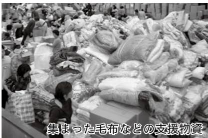
集まった毛布などの支援物資

3月11日（金）、国内観測史上最大のマグニチュード9.0を記録した東北地方太平洋沖地震は、私たちに自然の脅威をまざまざと見せつけました。市では、この被害を受けた都道府県のうち福島県相馬市へ支援物資を送ることとし、3月16日（水）18日（金）の3日間、広く皆さんに募ったところ、白米や毛布、自転車に赤ちゃん用おむつなどの日用雑貨が受付会場の市民会館大ホールを埋め尽くしました。集まった多くの物資は17日（木）、19日（土）、26日（出）の3回に分け、搬送しました。 支援物資を提供いただいた皆さん、また支援物資を仕分けていただいたボランティアの皆さん、ご協力ありがとうございました。今後、義援金など自分ができることから構いませ。一人ひとりが助け合いの精神を持ち、この難局を乗り越えていきましょう。