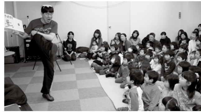
あきやまさん 行きポストに感想を書いた手紙を入れる子ども