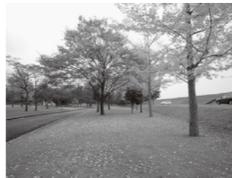
（施設イメージ写真）