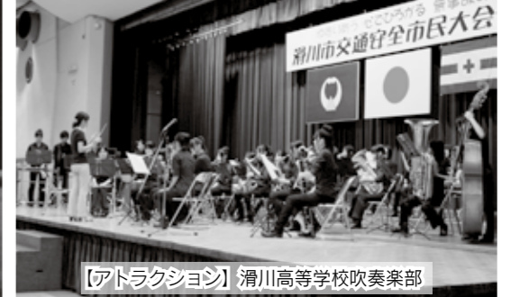
【アドラクション】滑川高等学校吹奏楽部