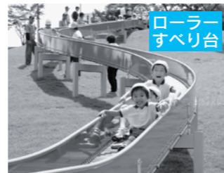
ローラーすべり台