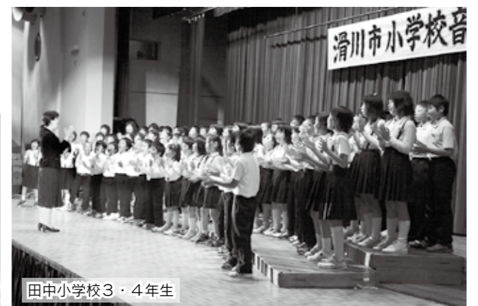
田中小学校3・4年生