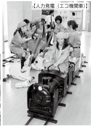
【人力発電(エコ機関車)】