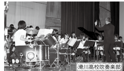
滑川高校吹奏楽部