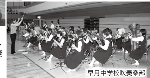
早月中学校吹奏楽部