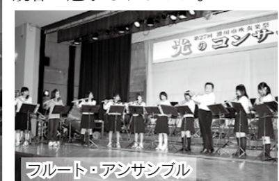
フルート・アンサンブル