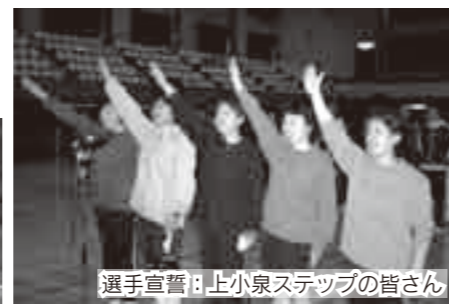
選手宣誓：上小泉ステップの皆さん