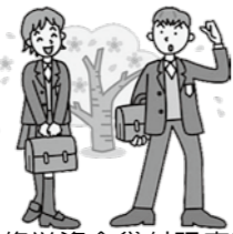
修学資金貸付限度額(月額) (単位:円)

母子および寡婦福祉法に基づき修学資金などの新規貸付申込受付を次のとおり行います。