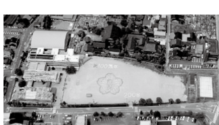
寺家小学校が創校100周年を迎える