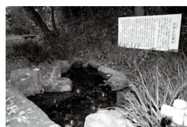
行田の沢清水が「平成の名水百選」に

2008年の主な出来事や話題をふり返ってみました。そして、2009年を新たな気持ちで迎えましょう。