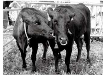
牛の放牧（カウベルトの郷づくり事業）