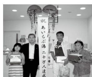
「あいらぶ湯」利用者20万人達成