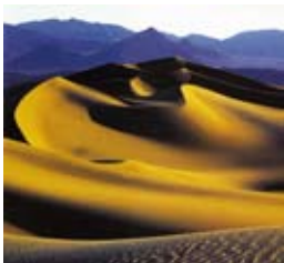
デスバレー (アメリカ合衆国)

白川義員に師事され世界の自然をライフワークとし、後世に残したい自然をとらえ、人間と地球の共生を考える。 とき 11月7日(金)〜24日(月) ※7日は午後2時開場 ところ 博物館3階