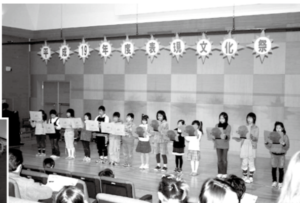
「北風と太陽」を英語と日本語で披露する児童たち