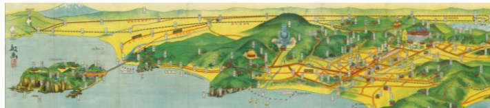
「鎌倉江の島名所案内」(当館蔵)