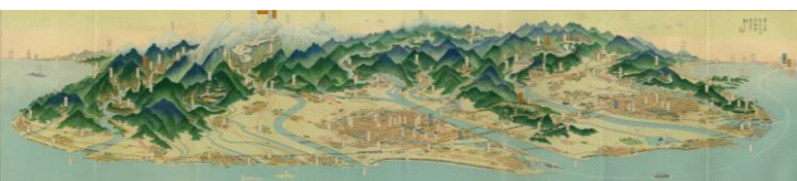
「富山県観光交通鳥瞰図」(富山県立図書館蔵)