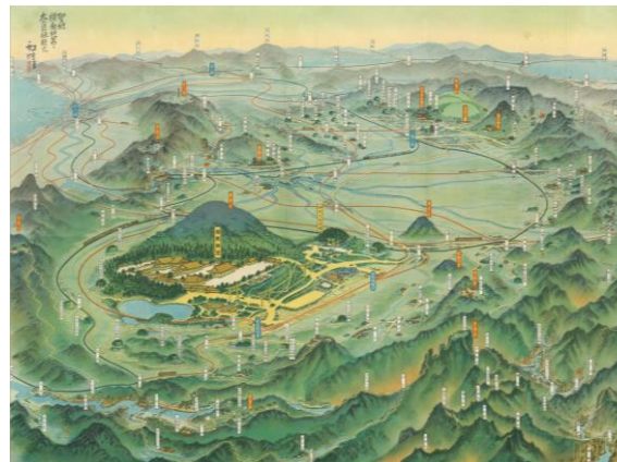
「聖地樞原神宮と奈良県観光」(当館蔵)