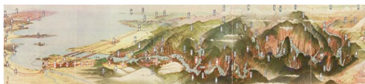
「黒部峡谷と宇奈月温泉」