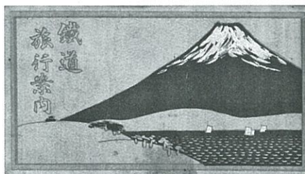
鉄道旅行案内(滑川市立博物館蔵)