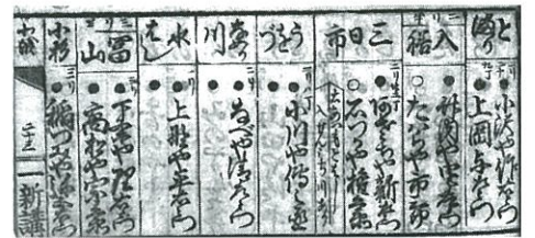
一新講道中手引草(富山県立図書館蔵)