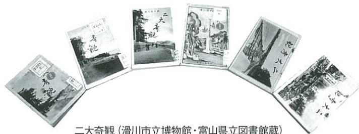
二大奇観