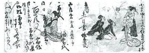
道中万事控帳(個人蔵)