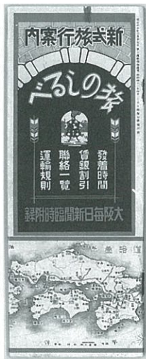
新式旅行案内 旅のしるべ(滑川市立博物館蔵)