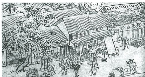
滑川の大蛸(『日本山海名産図会』、滑川市立博物館蔵)