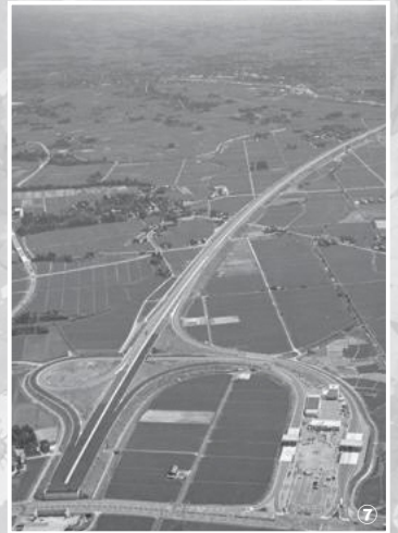
①中滑川-橋場線周辺(昭和37年頃)、②完成したあづま公園(昭和34年)、③櫛原神社前の山車曳き(昭和10年代頃)、④晒屋通り(昭和48年頃)、⑤滑川駅前団地(昭和50年頃)、⑥滑川町消防庁舎前のポンプ車(昭和20年代後半頃)、⑦滑川インターチェンジ(昭和56年頃)