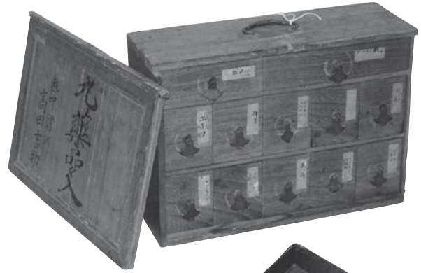
丸薬品々入れ (旅先での薬の整理箱)

本展では、市指定文化財を中心とした売薬にまつわる資料をご紹介します。「滑川の薬売り」やその得意先が使用した資料を博物館の企画展で多数出品するのは初めての機会です。是非ご観覧ください。