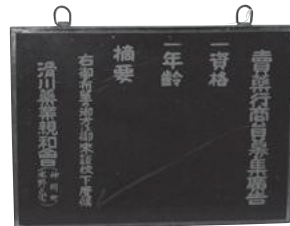
広告看板 (売薬行商員の募集看板)