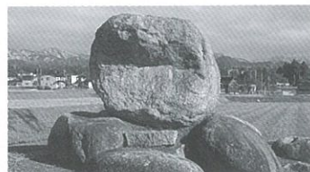
道寺のマンドウサマ(嘉永6年銘)