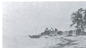
中川原の石浜(明治末期)