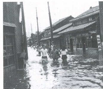
浸水した田中町(昭和30年代)