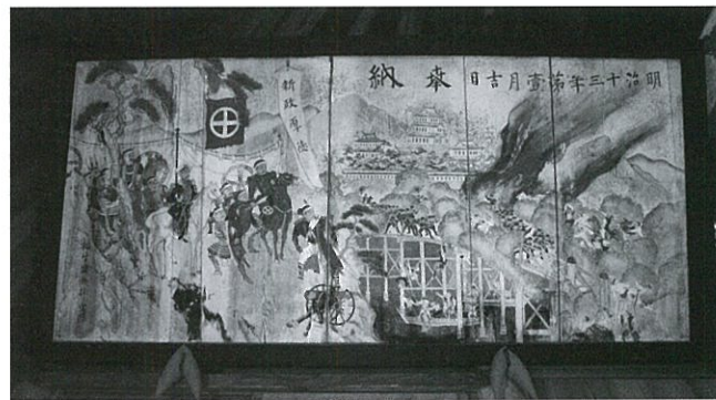
赤浜八幡社 「西南の役図」