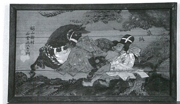
野町神明社 「黒馬図」