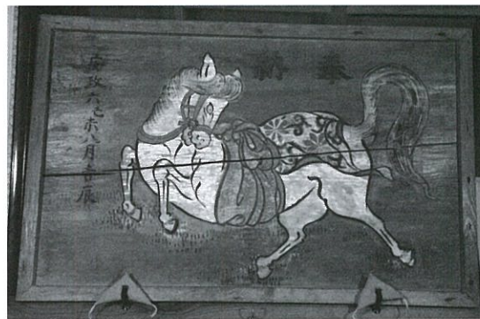
沖田新白山社 「跳馬図」

今回展示で紹介できない大絵馬もあり、この機会に地元へ足を運んで地域の文化財である絵馬を觀賞してみたいかがでしょうか。