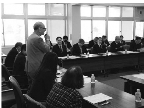
＜意見交換会の様子＞

※賛成者は○、賛成でない者は●、欠席者は欠としています。議長は採決に加わらないため「/」としています。