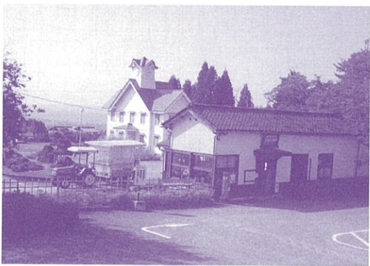
東福寺野自然公園

Q 市民会館大ホール建て替えの今後の具体的な方針・構想について見解を問う。 A 建設費用として三十億円程度を要するものと想定されることから、財源の十分な確保が課題であり、また構想時期についても、有利な財源の確保について検討しながら探っていきたくと考えている。 Q 深層水体験施設タラソピアの老朽化に伴う機械設備改修の今後の方針について見解を問う。 A 全面更新を行うとすると、多額の費用が掛かることから、最小限の修繕を行いつつながら、最小の経費で最大の効果を上げるべく維持管理に努めていきたいと考えている。 Q 千鳥スキー場の公共残土の廃棄盛土の安全性、並びに今後の活用方法について見解を問う。