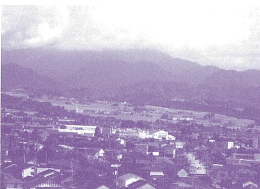
中山間地域の風景

Q 学年単独での教育指導が受けられるよう複式学級の回避として、市採用教員の配置の検討について見解を問う。 A 担任以外に通級指導、英語専科、理科専科教員等を配置し、きめ細かな教育活動の充実を支援しており、市採用教員の配置は、考えていない。 Q 小学校を拠点とした地域づくりとしての、コミュニティスクール制度導入の推進について見解を問う。 A 幅広い地域住民、団体等に活動推進員となつていただき、学校と連携し、良い地域・学校を目指す地域学校共同活動を推進することが大切と考えている。 Q 小学校周辺整備としての駐車場の設置整備の取り組み状況について見解を問う。