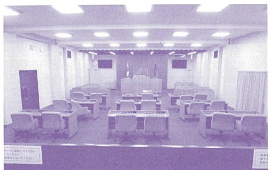
滑川市議会本会議場