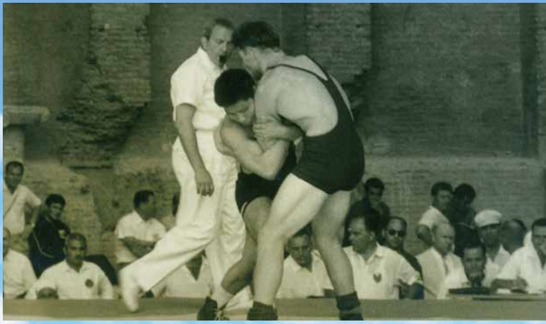
ローマオリンピックで活躍する石倉俊太選手（レスリング）[1960年]