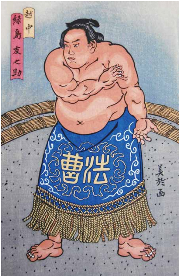
滑川出身の力士 緑嶋友之助 [1991年/当館蔵]