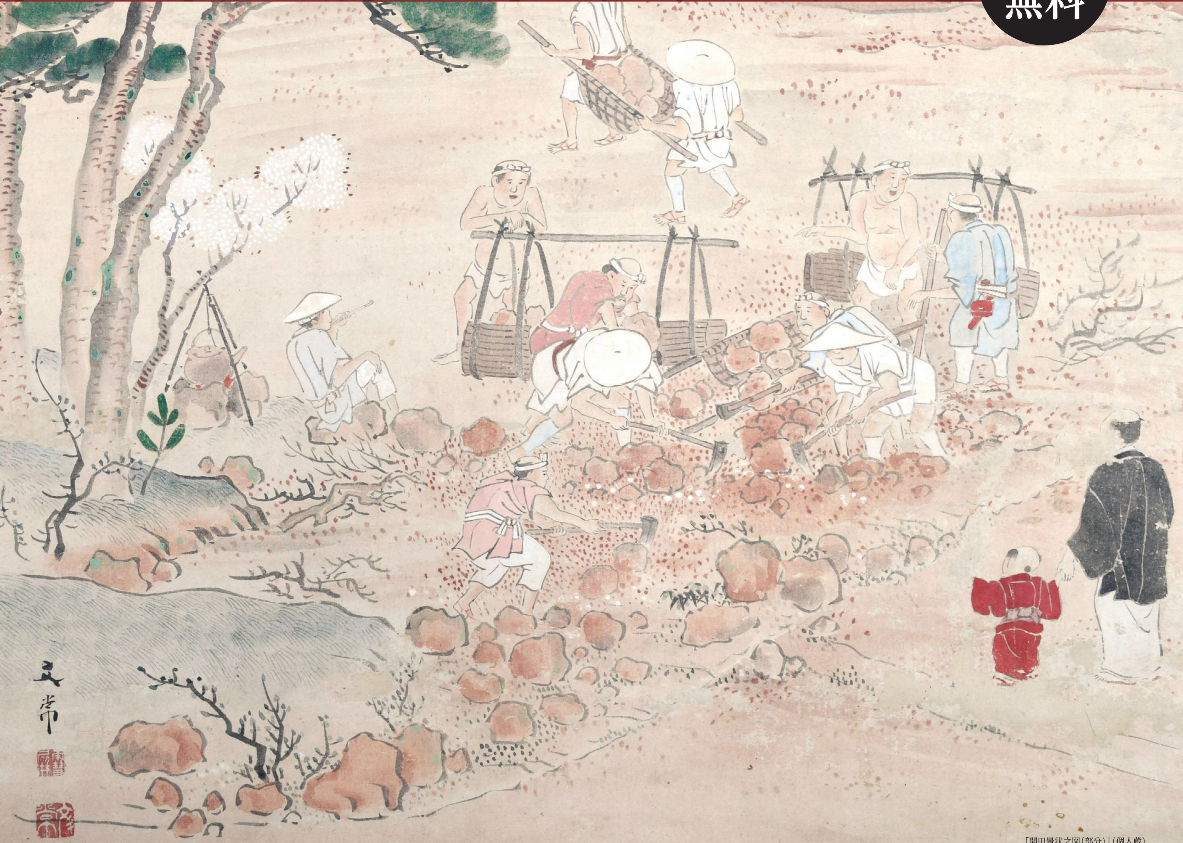
「開田景状之図(部分)」(個人蔵)