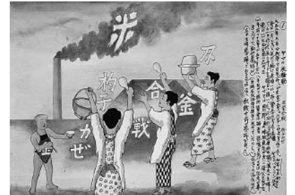
⑥ヤマの米騒動1(福岡県)