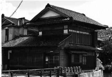
④廣野家住宅主屋(国登録有形文化財)