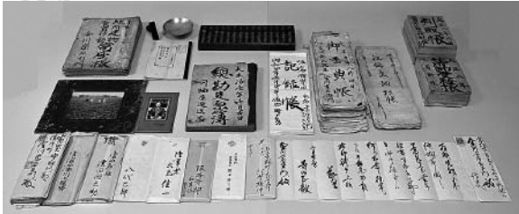
②金川宗左衛門家文書