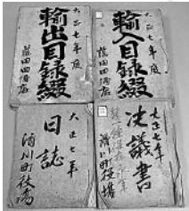
①滑川町役場日誌ほか