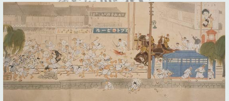
泥江橋付近カプトビル前(部分) (「米騒動絵巻」第2巻) 徳川美術館蔵