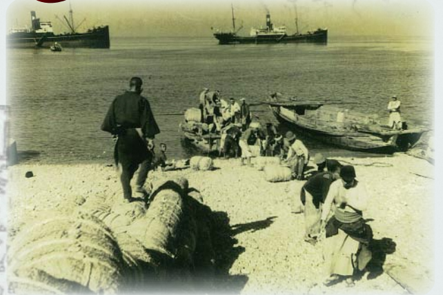
米の積み出し(昭和前期頃) 滑川市立博物館蔵