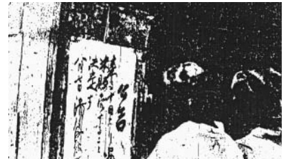
⑤廉売広告を見る滑川町民