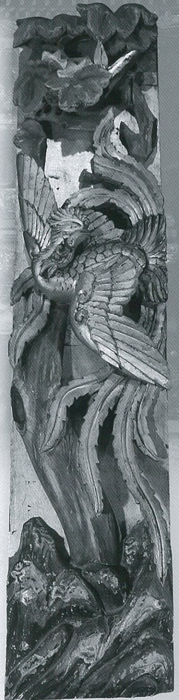
▲高砂山屋台装飾 明治29年