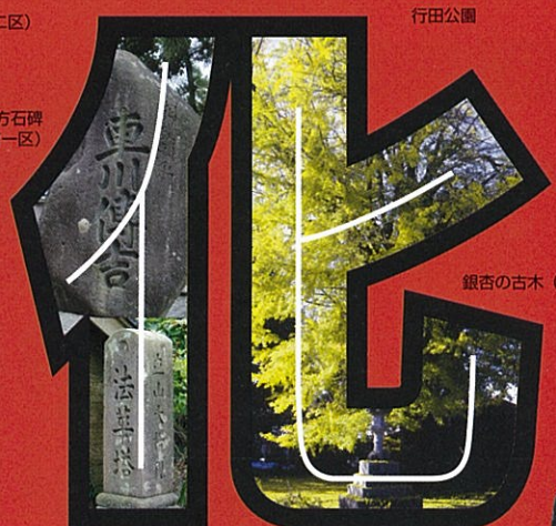
法華塔 (加島町一区)