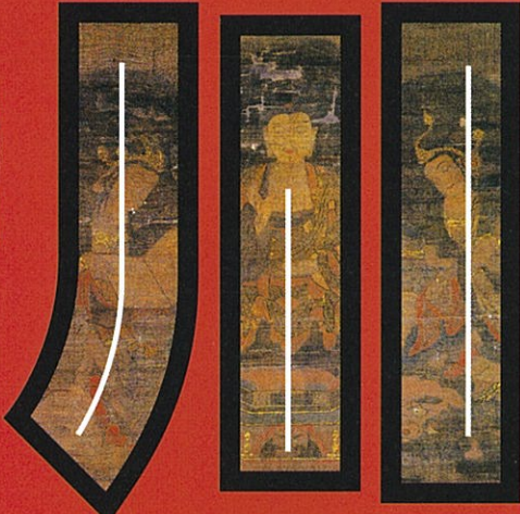
釈迦三尊三幅図 (徳城寺蔵)