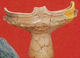
縄文土器台付鉢 (滑川市教育委員会蔵)