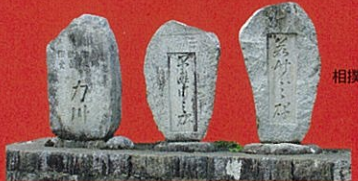
相撲力士記念碑 (杉本)