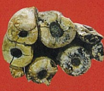
デスマスチルスの白歯 (滑川市立博物館蔵)