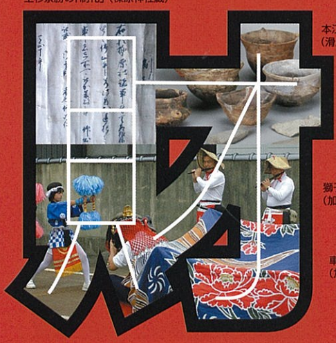
獅子舞 (加島町二区)