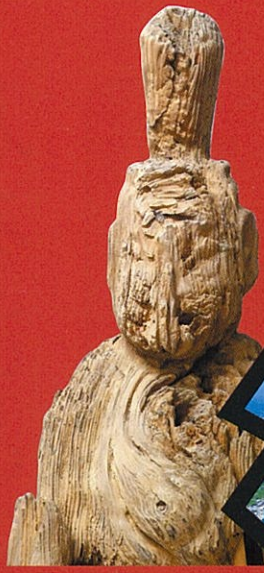
左大臣 (加積神社蔵)