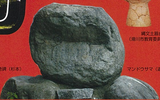
マンドウサマ (道寺)